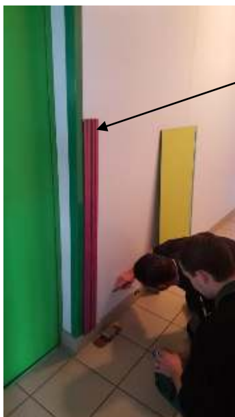
Tasseau de départ