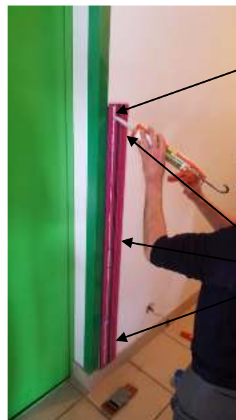
Cordon de colle